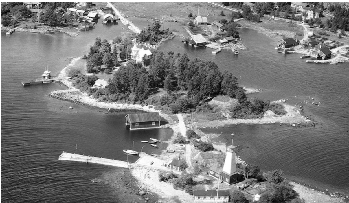
Vy över Bönan 1948.

– En sådan satsning bedömdes kunna stärka områdets attraktionskraft, fördjupa platsens identitet och skapa mervärden för såväl lokalsamhället som besöksnäringen. Förstudien pekade också på goda möjligheter till samverkan med befintliga verksamheter och aktörer med koppling till kust, sjöfart och turism.